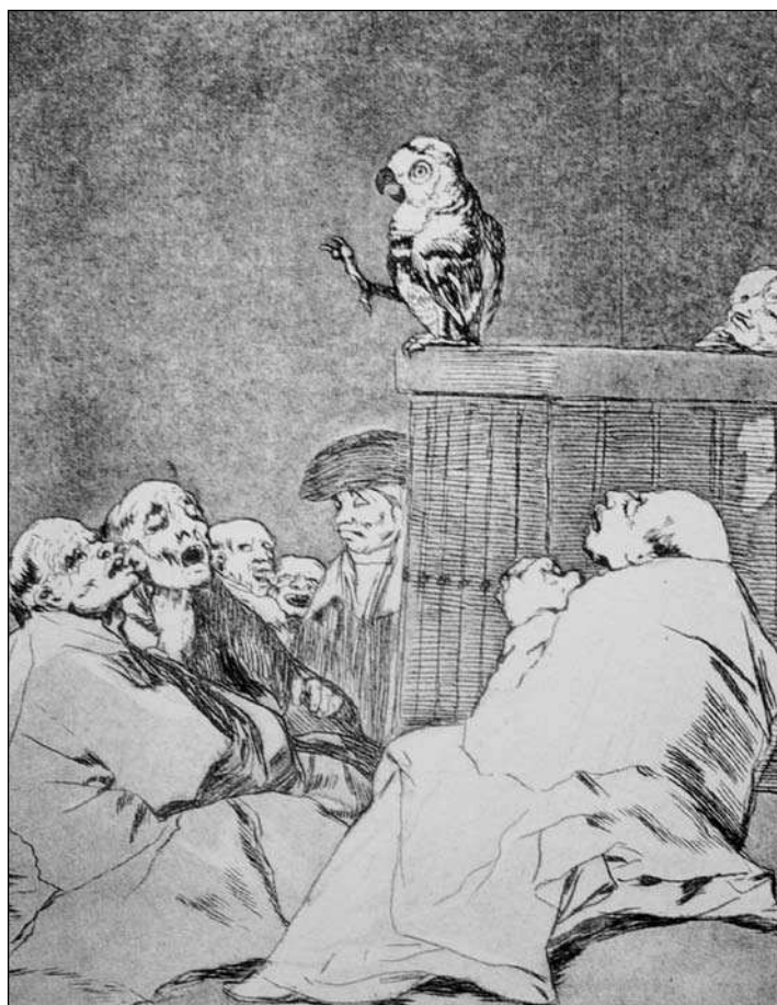
Francisco Goya y Lucientes, Złotousty ( Que pico de Oro! )

Wygląda to trochę na wykład uniwersytecki. Może papuga mówi o medycynie? W każdym razie, nie wierz ani słowu.