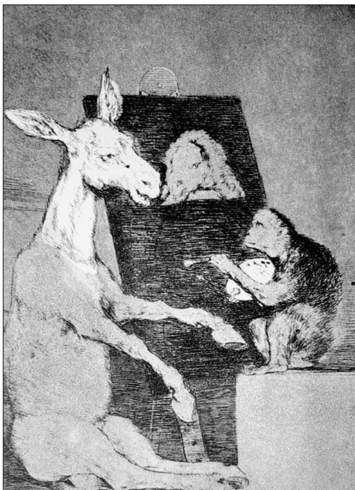
Francisco Goya y Lucientes, Ni mniej, ni więcej ( Ni mas ni menos )

Ma rację, każąc malować swój portret; w ten sposób ci, co go nie znają i co go nie widzieli, dowiedzą się kim jest. (komentarz autora grafiki)